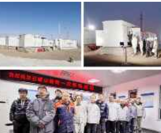
■ (宁夏石嘴山光伏项目 李琼)

由于该项目为石嘴山市首家储能项目，电网接入及各政策处于探索阶段，自项目开工建设以来，在当地政府、国投电力的大力支持下，项目与各参建方齐心协力共同克服各类困难，各级人员严格履行到岗到位管理要求，安全、有序推进推进各项工作，为项目全面运行奠定基础。 下一步进入设备带电调试阶段，项目将以“严、细、实、深、俭、廉”的工作作风要求，精准制定工作计划，保障储能高效率开展带电调试，及早投运，尽快发挥储能移峰填谷、顶峰发电等作用，为公司提质增效贡献力量。