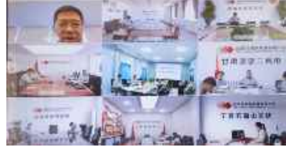
■(计划经营部 李佩沛)

此次培训进一步强化了各项目保险理赔工作，为有效避免保险损失漏赔、低赔和晚赔等情形提供了有力保障。