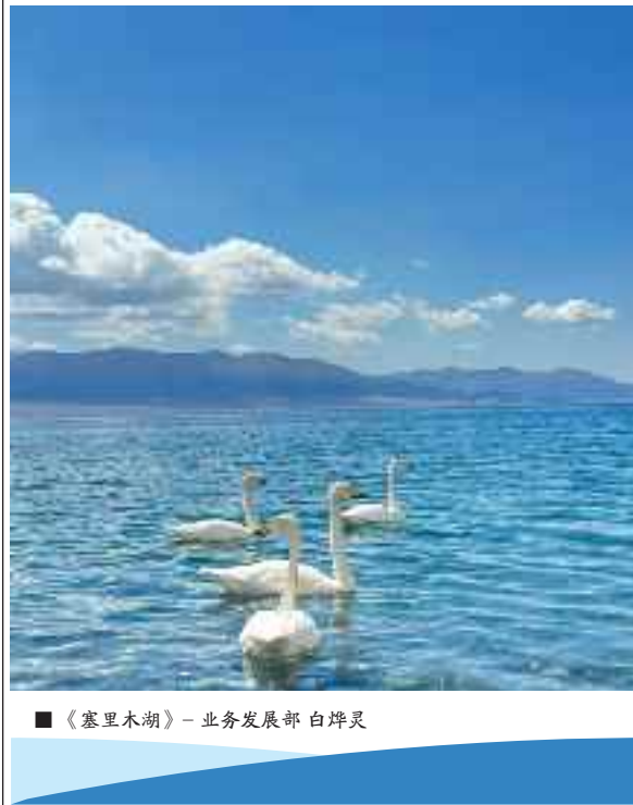
■《塞里木湖》- 业务发展部 白烨灵