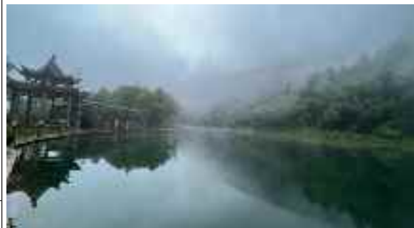
■《官鹤沟 - 泽落措》综合管理部 胡妍丽