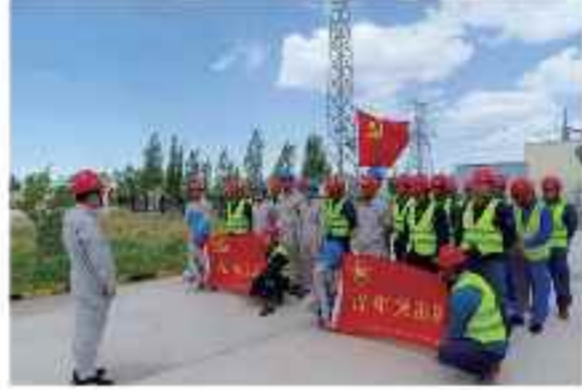
贝壳梁风电项目运维班荣获“卓越班组”称号。

近日,贝壳梁风电项目运维班荣获“卓越班组”称号。这是该项目自投运以来首次获得此项荣誉,也是运维班全体成员共同努力、辛勤工作的结果。运维班负责人表示,班组全体成员始终坚持以安全生产为中心,严格执行各项规章制度,确保设备安全稳定运行,为公司安全生产做出了积极贡献。 运维班在安全生产方面取得了显著成绩,全年未发生任何安全事故,设备故障率极低。班组还积极开展各项技能培训和应急演练,提高了员工的业务素质和应急处置能力。未来,运维班将继续发扬“追求卓越”的精神,不断提升班组管理水平,为公司高质量发展做出更大贡献。