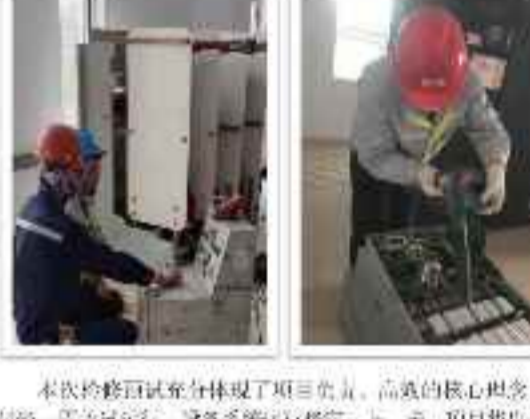
党员先行, 提质增效, 三措并举, 创新共赢。

党员先行, 提质增效, 三措并举, 创新共赢。这是企业在推进高质量发展过程中, 必须坚持的一种工作思路。企业要通过发挥党员的先锋模范作用, 提高企业的管理水平和运营效率, 实现企业的创新发展, 创造更大的价值。 党员先行是企业发展的引领, 提质增效是企业发展的关键, 三措并举是企业发展的基础, 创新共赢是企业发展的动力。企业要通过这四方面的努力, 不断提升企业的核心竞争力, 实现企业的可持续发展。