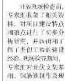
甘肃敦煌光伏项目三期工程首次质量检查验收工作顺利完成。

2022年5月7日至9日,由青海格尔木光伏项目三期工程监理单位组织,施工单位、监理单位、设计单位、建设单位共同参与的甘肃敦煌光伏项目三期工程首次质量检查验收工作顺利完成。检查组对施工现场进行了全面检查,对施工质量进行了详细评估,并对存在的问题提出了整改要求。施工单位表示,将认真落实整改要求,确保工程质量,按期完成项目建设任务。