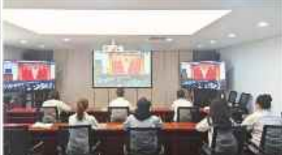
2022年5月9日,团员青年收听收看中国共产主义青年团成立100周年大会。

2022年5月10日上午,共青团中央在北京人民大会堂隆重举行中国共产主义青年团成立100周年大会。公司团委组织团员青年收听收看大会实况,广大团员青年纷纷表示,要继承和发扬共青团的光荣传统,坚定理想信念,练就过硬本领,矢志艰苦奋斗,努力成为担当民族复兴大任的时代新人。 会上,公司团委负责人表示,共青团是党的助手和后备军,要始终把党的政治建设摆在首位,教育引导广大团员青年听党话、跟党走,不断增强“四个意识”、坚定“四个自信”、做到“两个维护”,为实现中华民族伟大复兴的中国梦贡献青春力量。