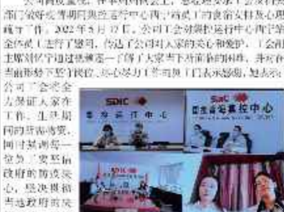
公司工会慰问集控运行中心西宁站员工。

近日,青海省西宁供电公司工会组织慰问集控运行中心西宁站员工。慰问组向员工们致以诚挚的问候,感谢大家在疫情防控期间坚守岗位、辛勤工作,为公司的安全生产做出了重要贡献。慰问组还向员工们发放了慰问金和慰问品,表达了公司对员工的关心和关爱。 西宁站员工表示,将不辜负公司的信任和重托,继续发扬吃苦耐劳、无私奉献的精神,扎实做好本职工作,为公司的发展贡献更大力量。