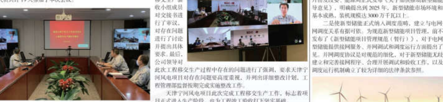
图1 天津宁河风电一期项目工程移交生产会议